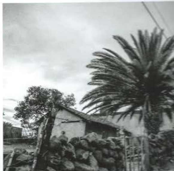
Yutaka Sone bij zijn atelier in Michoacán, Mexico. Prijsindicatie van zijn werk: tussen € 20.000 en € 80.000.

Galerie Transit Zandpoortvest 10 Mechelen www.transit.be 13-11 t/m 18-12