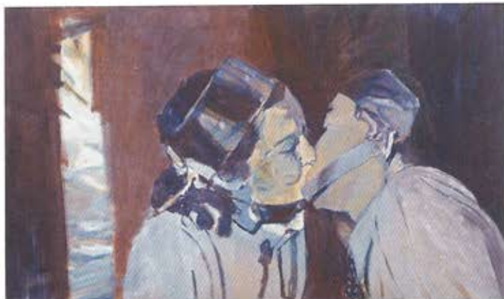
Johan Clarysse, 'Les charmes discrets du pouvoir (the true nature of love)', 2016, olieverf op doek, 60 x 100 cm. Courtesy Johan Clarysse en S&H De Buck, Gent. Prijs: € 3590, andere schilderijen tussen € 1550 en € 8600.