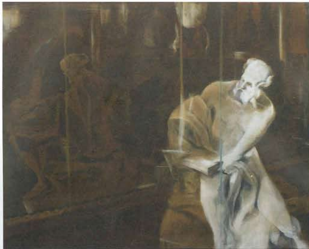
Reniere & Depla, 'Hidden Selfportrait', 100 x 80 cm, acryl op doek

Sta me toe heel even de filosofische toer op te gaan. Structuralisme, iconografie, semiotiek en andere vormen van relativisme, zij delen het geloof dat de picturale betekenissen bepaald worden door regels, codes, symbolen of conventies. Al die linguïstische zaken spelen uiteraard wel een rol, maar zij leggen niet de vinger op de meest primaire betekenis, te weten: 'the eye of the painter'. Men kan niet genoeg de nadruk leggen op de bijzonder fijnmazige differentiaties waarin schilderkunst excelleert inzake toets, verfsoort, plasticiteit, lichtinval, kadrering, fingerspitzengefühl, enz. om een thematiek met de grootste precisie en intentie op een plat vlak uit te tekenen en te borstelen. 'Hoe' een schilder iets met serendipiteit bricoleert, in het particuliere proces van zowel bewuste als onbewuste bedoelingen, daarover gaat het. Wanneer we dan daarin zoiets schimmigs als een stijl menen te ontdekken (ter wille van een overmoedige, kunsttheoretische grip op controle), dan gaan we voorbij aan de subjectieve voorgeschiedenis van elke individueel idioom. Moeten wij wel zo dwangmatig speuren naar hoezeer al de werken van een schilder op mekaar lijken of hoe deze van een ander schilder afwijken? Wat de toeschouwer te zien krijgt is al