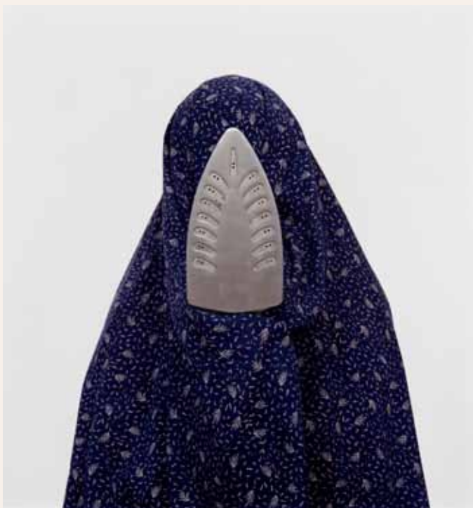
Shadi Ghadirian, Like everyday #17 (louche) Domestic Life series , 2000, AeroPlastics Contemporary, Brussel