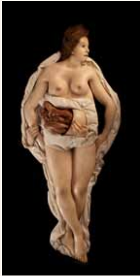
Spitzner, vrouw , 20 de eeuw, was, Musée de la Médecine, Brussel