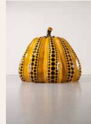
Yayoi Kusama, Pumpkin , Caldic Collectie, Wassenaar

Two centuries of women and their psychiatrists