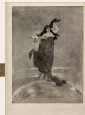
Félicien Rops, La femme et la folie dominant le monde , 1882, heliogravure, Musée provincial Félicien Rops, Namen

Fototentoonstelling over missverkiezingen in Vlaanderen