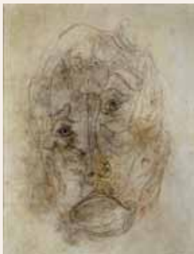
Unica Zürn, Zonder titel (portret van Hans Belmer) , 1965, gouache en aquarel op papier, Galerie abcd, Parijs

Vrouwen worden al eeuwenlang als 'nerveuzer' beschouwd dan mannen, eerder ten prooi aan labiliteit en geestesziekte, vaker lastiggevallen door geesten en demonen. Maar zijn zij nu ook in werkelijkheid 'zieker van geest'?