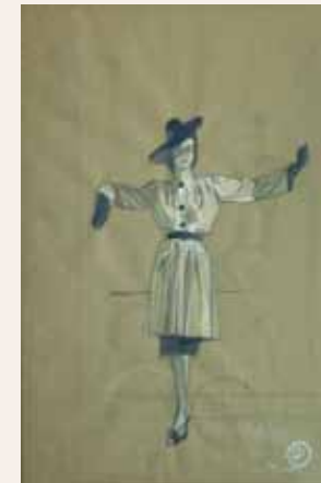
Luc Tuymans, Vrouw op groene buvard II , datum (?), techniek (?), Galerie Adrian David, Knokke

For centuries, women have been considered more 'nervous' than men, more susceptible to instability and mental illness, more often bothered by spirits and demons. But are they really more 'mentally ill'?