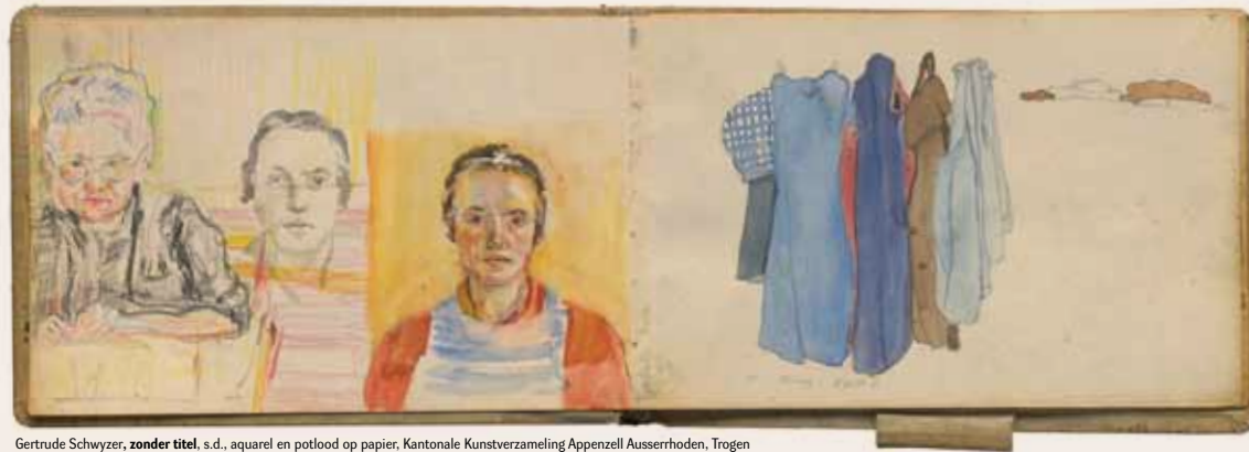
Gertrude Schwyzer, zonder titel , s.d., aquarel en potlood op papier, Kantonale Kunstverzameling Appenzell Ausserrhoden, Trogen

Nerveuze vrouwen wil het debat over de 'specifieke' positie van de vrouw in de psychiatrie stofferen. Nerveuze vrouwen is een tentoonstelling die het heeft over manie, melancholie, zwakke zenuwen, theatrale tics, hartstochtelijke liefde, zelfverminking, verveling, rebellie, zelfuithongering.