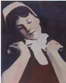
Johan Clarysse, Suspicious portraits (Agnes) , 2012, olie op doek, collectie kunstenaar, Brugge